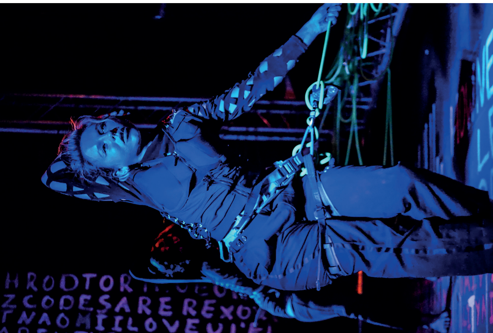
{Data} Performance de danse acrobatique par Duo Ponele