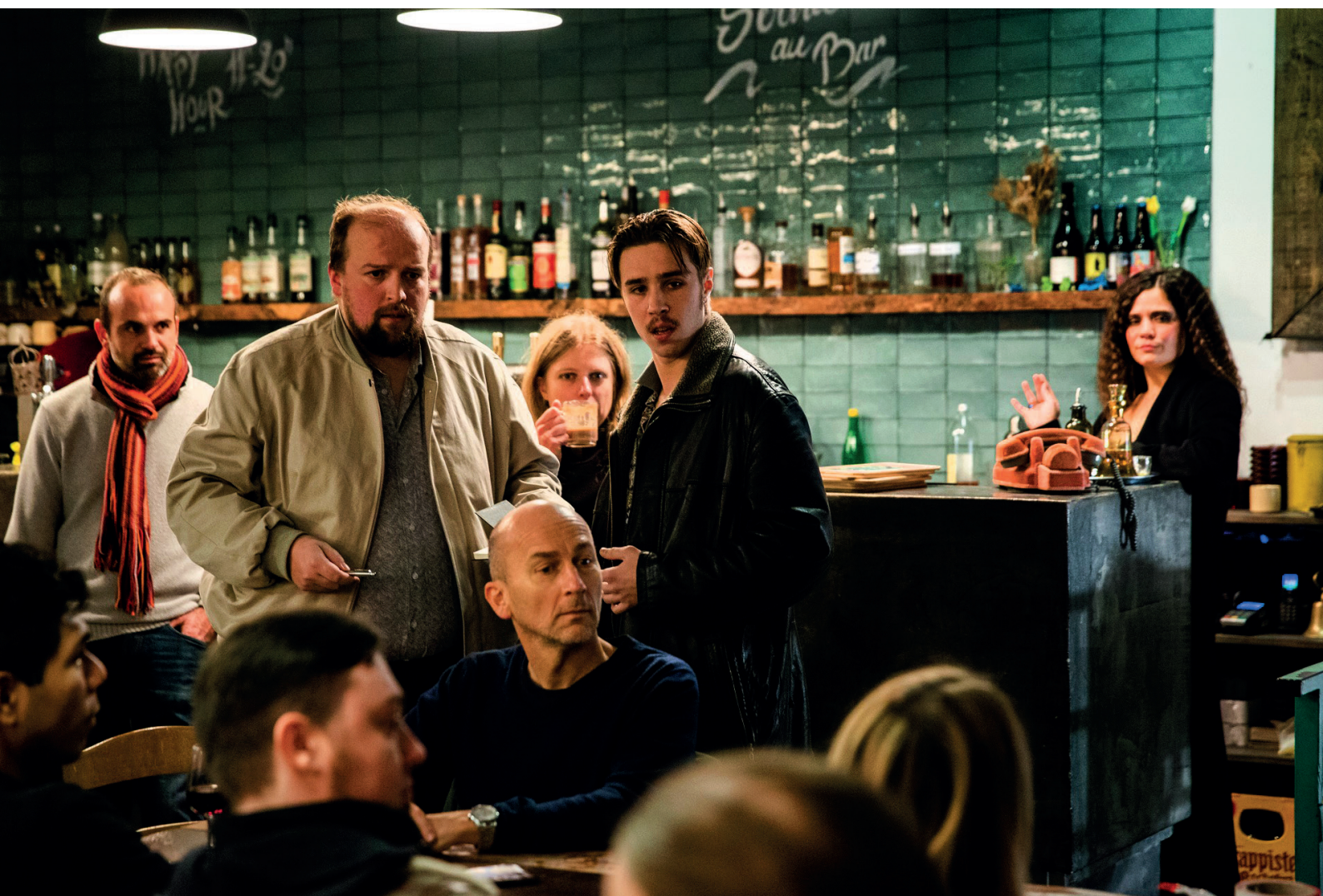
{Le Grand Hotel de Mme Charon} Enquête immersive par la Cie Les Gens Normales