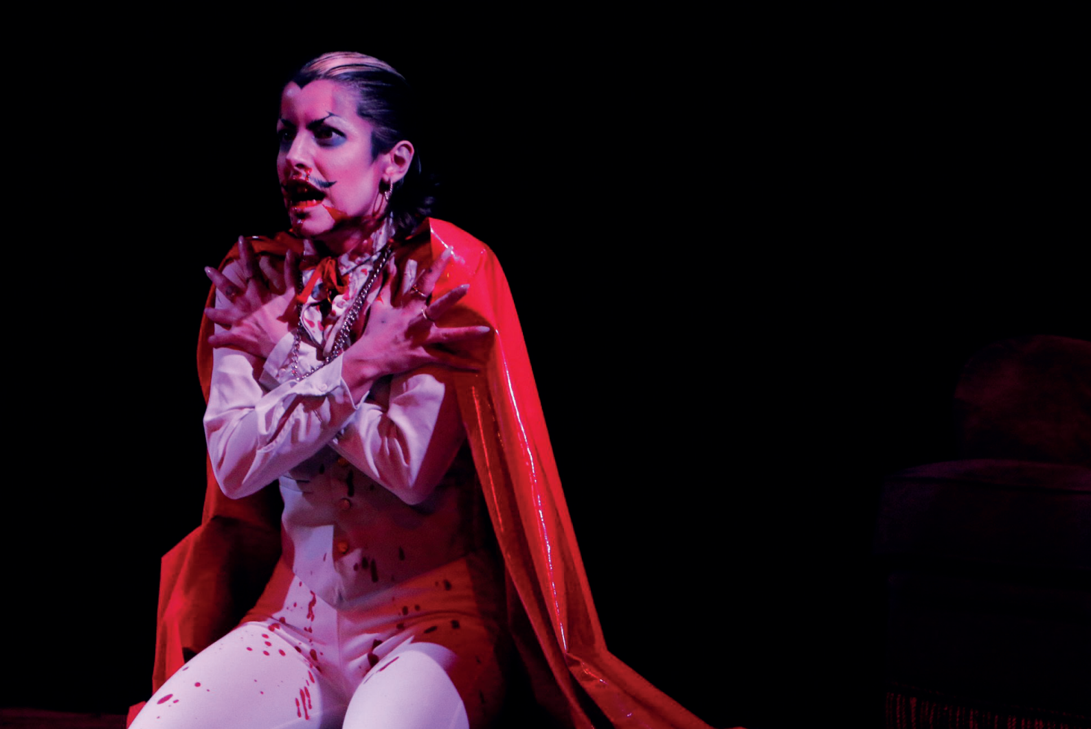
{Cabaret Ferri Venti & Guests } Cabaret Drag